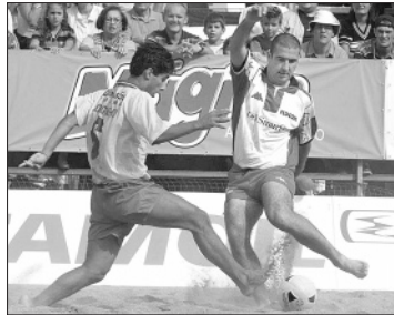
Jorginho contra Eric Cantona, que foi muito aplaudido

O time brasileiro volta à quadra de areia montada especialmente para a Copa Príncipe Albert no Porto de Monte Carlo, hoje, para decidir o título com a seleção de Portugal.