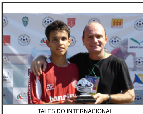
TALES DO INTERNACIONAL