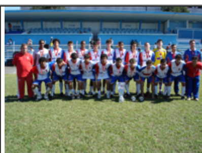
PARANÁ CLUBE 2º Lugar