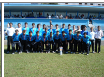
GRÊMIO F. P. 3º Lugar