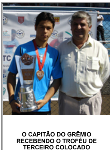
O CAPITÃO DO GRÊMIO RECEBENDO O TROFÉU DE TERCEIRO COLOCADO

A decisão de terceiro e quarto colocados acabou não acontecendo em função do pedido do Flamengo junto a organização. O motivo foi problemas clínicos com uma atleta, antecipando o retorno da equipe ao Rio de Janeiro.