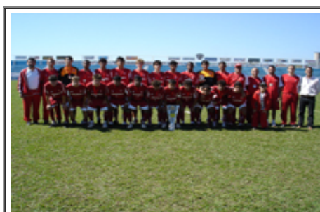
S. C. INTERNACIONAL 1ª Lugar