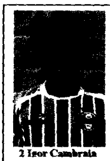
2 Isor Cambrata