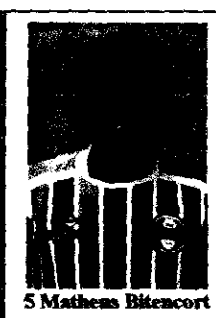
5 Matheus Bitencort