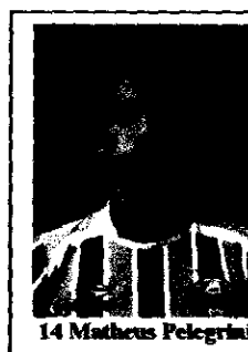
14 Matheus Pelegrini