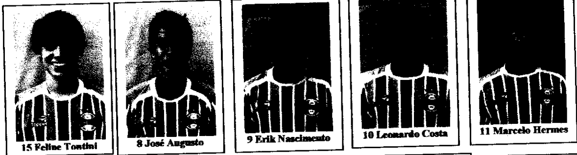
15 Felipe Tontini